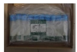
10本入 \times 2袋