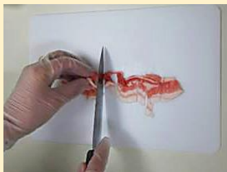
①豚肉使用後の調理器具等