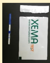
イムノクロマトストリップ RapidFields (X316)